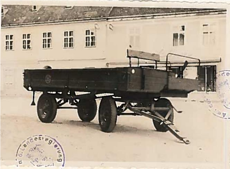
Abbildung aus dem Bescheid

1961 erwarb Otto Blauensteiner (1925-2010) vom Pulkauer Erzeuger Heinrich Gangl Fahrzeugbau für seinen Traktor einen neuen Anhänger des Typs Gangl 2.5 to .